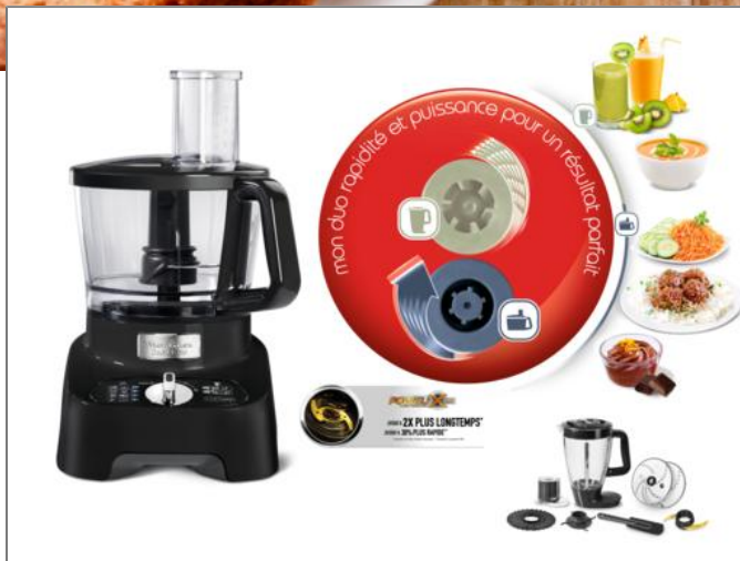
DOUBLE FORCE 1000 W NOIR + 8 ACCESSOIRES ROBOT MULTIFONCTION FP821811