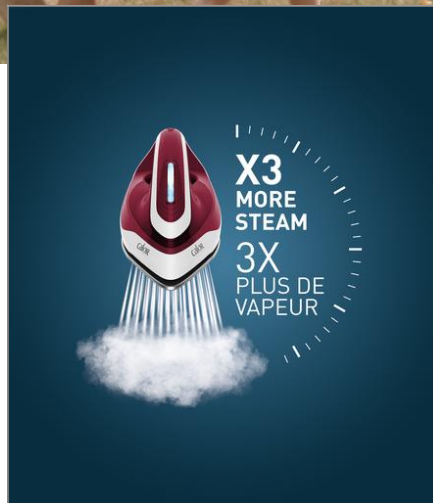
EXPRESS EASY 5.7 BARS BOURGOGNE OPAQUE CENTRALE VAPEUR SV6130C0

Réduit votre temps de repassage de 30 %*