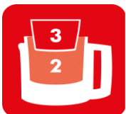
BOLS 3 EN 1