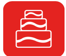
PÂTISSIER XL jusqu'à 16 parts

Livre de recettes inclus : 300 recettes pour votre quotidien