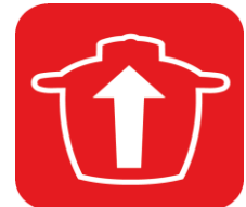
BOL XL 4,8 L jusqu'à 16 personnes

Vapeur XL : pour des préparations saines au quotidien. Préparez jusqu'à 8 pavés de saumons et 2kg de légumes.