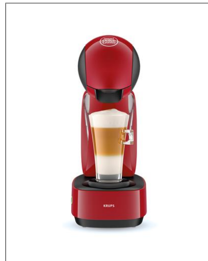
INFINISSIMA NESCAFE DOLCE GUSTO ROUGE YY3877FD