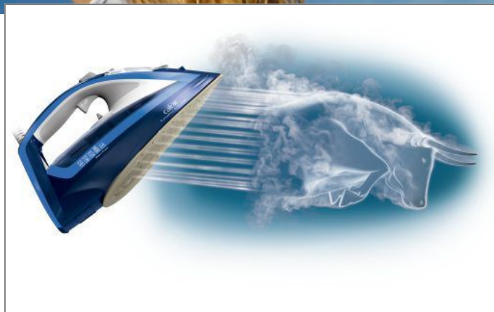
TURBOPRO ANTI-CALC FV5630 FV5630C0